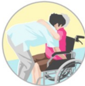
Überlastung und Fehlbelastung