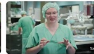
Die Ausbildung zur Fachkraft für Medizinprodukteaufbereitung - FMA-... 95 Aufrufe · vor 1 Monat