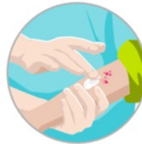
Kontakt mit Medikamenten