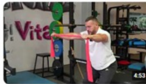
DGSV e.V. AEMP-FIT - Übung 2 - Frontheben 29 Aufrufe · vor 1 Monat