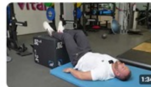
DGSV e.V. AEMP-FIT - Übung 5 - Stufenlagerung 37 Aufrufe · vor 1 Monat