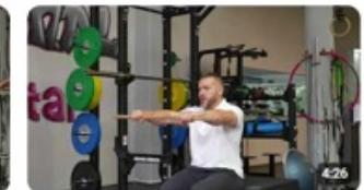
DGSV e.V. AEMP-FIT - Übung 3 - Kniebeuge 20 Aufrufe · vor 1 Monat