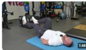
DGSV e.V. AEMP-FIT - Übung 6 - Fahrradfahren 18 Aufrufe · vor 1 Monat