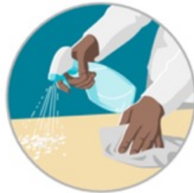
Reinigungs- und Desinfektionsmittel

Berufskrankheiten im Gesundheitswesen können unter anderem entstehen durch