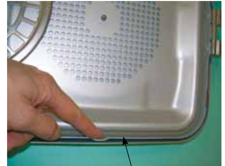
Guarnizione coperchio: In sede Senza rotture / deformazioni.