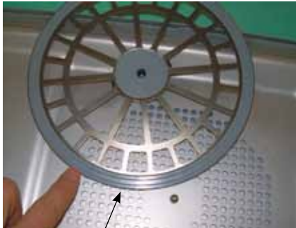
Fissa filtro: Idoneo al contenitore e al tipo di filtro da applicare. Guarnizioni integre.