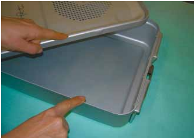
Tenuta: coperchio Assenza deformazioni/ammaccature sui margini di chiusura.