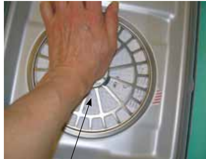
Fissa filtro: Aggancio sicuro al coperchio.