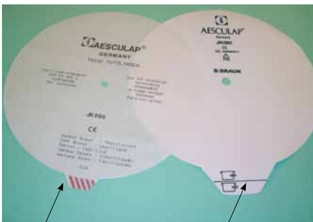
Filtro: Se carta, NUOVO.