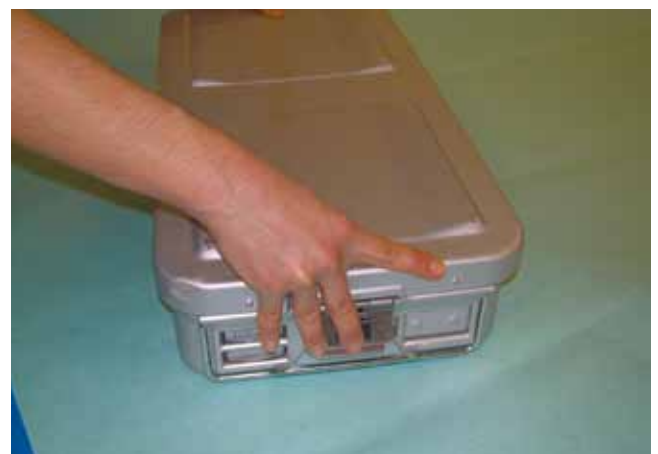
Chiusure: Sicure, devono opporre resistenza durante chiusura/apertura.