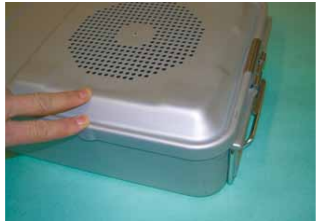
Tenuta: fondo / coperchio Ben aderente al bordo del container in tutte le sue parti.